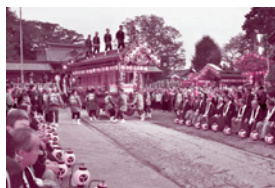
【屋台繰り出しロード】