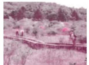
【横根高原 井戸湿原】