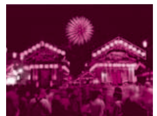
【鹿沼ぶっつけ秋祭り】