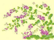
ヤマハギ (9月上旬～ 10月下旬)

※その年の気候によって、見頃が若干変わる場合があります。その他、季節によって、ヤマザクラやナツツバキ、ヤマモミジなどの花や紅葉を見ることができます。