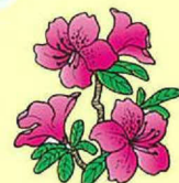
ヤマツツジ (4月上旬～ 5月上旬)