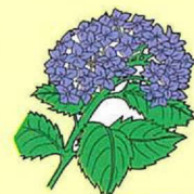
ヤマアジサイ (6月上旬～ 7月下旬)