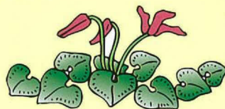
カタクリ (3月中旬～ 4月上旬)